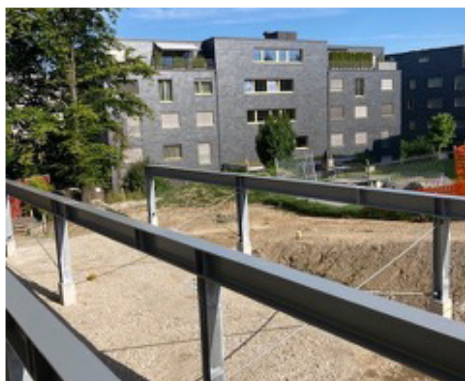
Die Stahlträger für die ersten Zimmer – Module stehen bereit.

Auch wenn wir nach wie vor gut im Zeitplan sind, gibt es bei der Lieferung der Module Verzögerungen. Nicht wie geplant Ende August sondern Mitte September werden die ersten Module angeliefert. Wöchentlich an jeweils drei Tagen werden die Module eintreffen. Der Innenausbau, wie etwa das Legen des Parketts im Korridor, wird vor Ort erfolgen. Auch der Übergang zum bestehenden Gebäude kann erst fertig gestellt werden, wenn alle Module stehen.